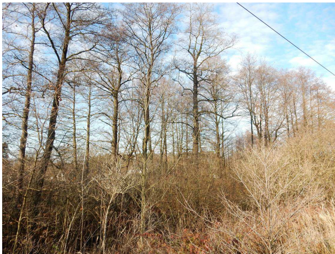
Obr. Díky rozšíření o druhou kolej budou dotčeny i dnes vzdálenější vzrostlé olše v km 19,1