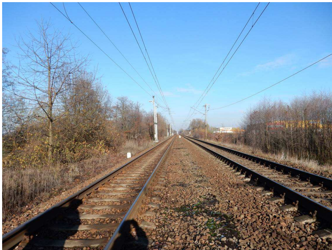
Obr. situace v km 18,0