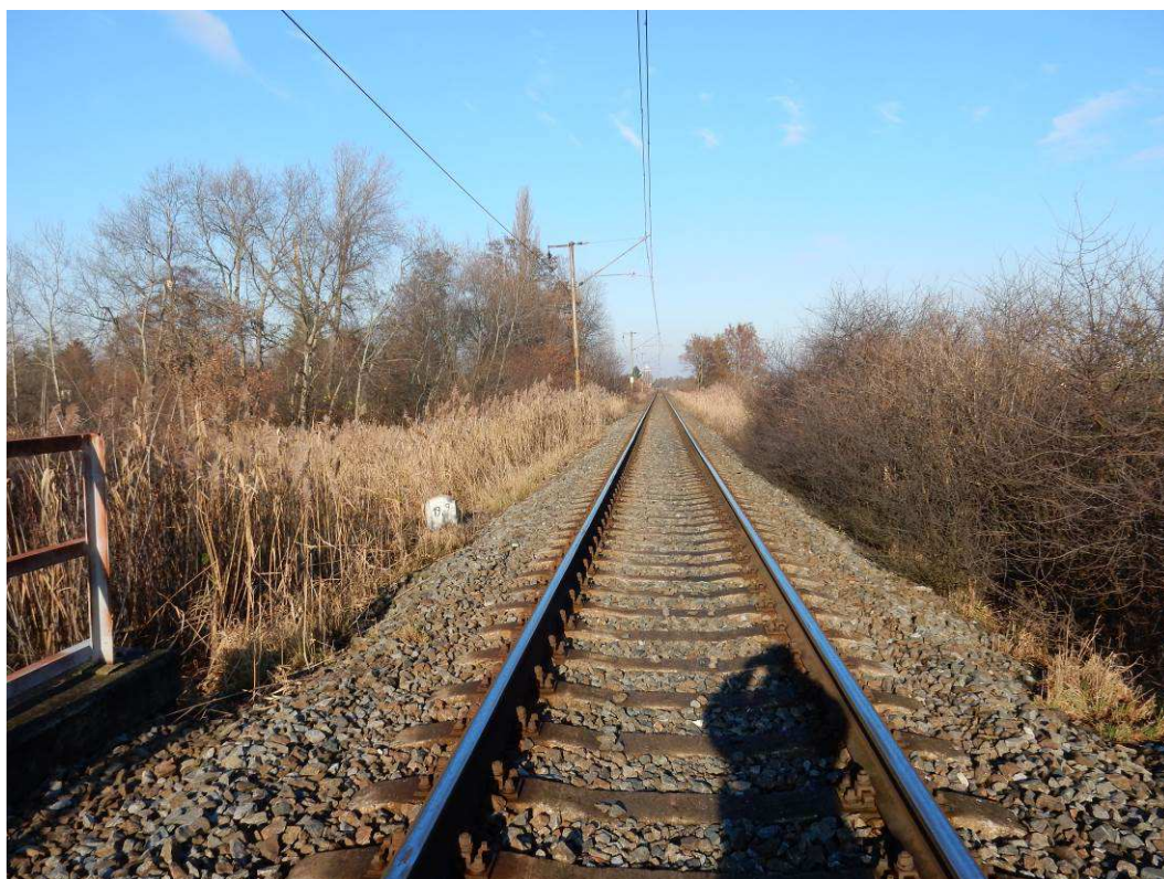
Obr. situace v km 19,9