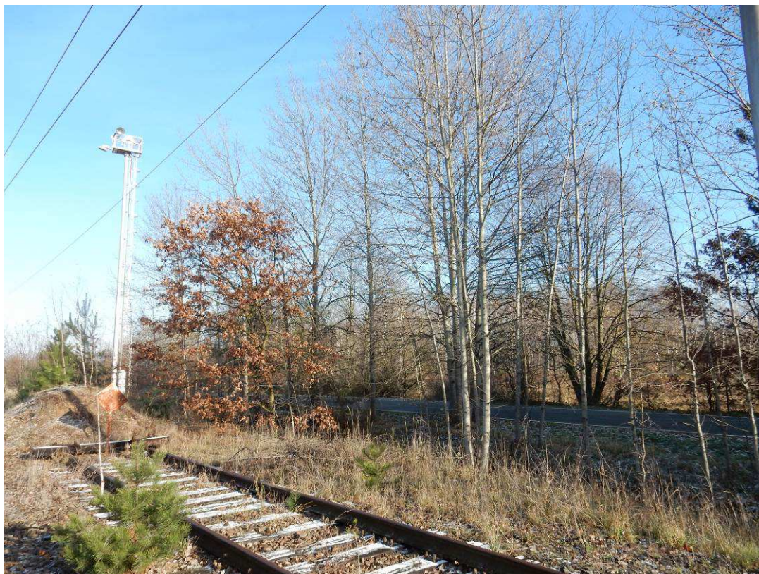
Obr. Převážně osikové porosty v km 17,55