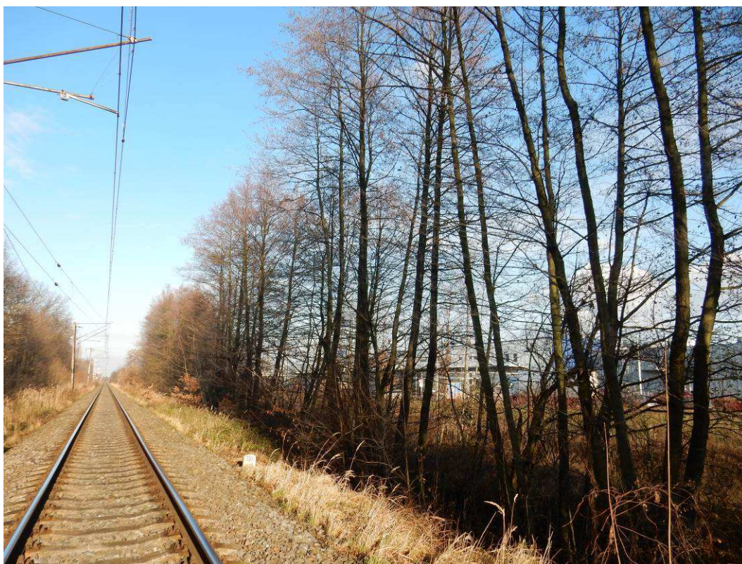
Obr. situace v km 19,6