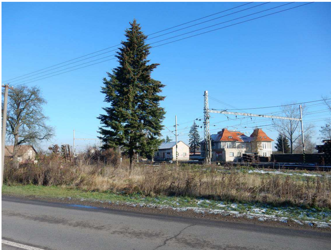
Obr. Mohutnější douglaska u žst. Opatovice nad Labem (km 16,5)