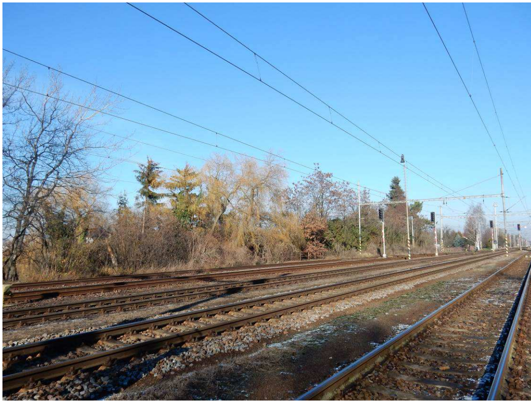
Obr. Křížení Plačického potoka – km 17,3